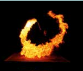
FAVILLA KL. 22.30