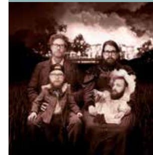
SISTA DROPPEN KL. 21.15