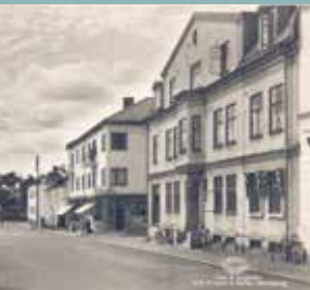
FOTOUTSTÄLLNING GAMLA ÄLMHULT