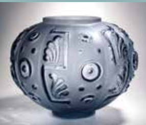
HAR DU EN SKATTGÖM- MA? KL. 17.00–20.00