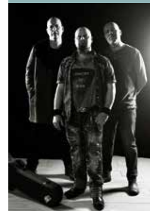
INDEED KL. 19.15