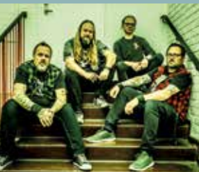
THE DRYHEAVES KL. 19.00