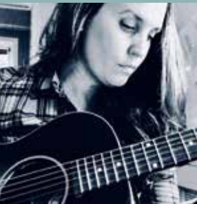
MAGPIE KL. 19.30