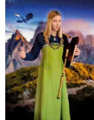
SIGRID OCH DRAKEN KL. 17.20 OCH 20.00

Kl. 23.15. Final Days Society. Ett indie-/post-rock-band från Växjö som bjuder på dynamisk, känsloladdad och storslagen musik. Albumet ”Ours is not a caravan of despair” utsågs till ett av årets bästa album 2011 av Joyzine. Dessutom fick låten ”60” agera soundtrack i kortfilmen ”Prinsen” med Adam Pålsson. Bandet släppte sitt tredje album ”Ice-breaker” i mitten av 2015 och har sedan dess hunnit göra spelningar både i Sverige och runt om i Europa. Första gången på scen i Älmhult spelar de intensiv postrock som inte lämnar någon oberörd. Missa inte chansen att uppleva Smålands alldeles egna wall of sound! Music. Arr: ABF