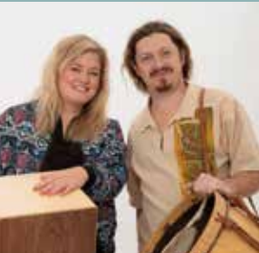
TRUMATTACK KL. 17.45 OCH 20.00