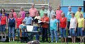
ELMEKÖREN KL. 17.00