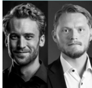
SMÅLANDSOPERAN KL. 17.00–18.00