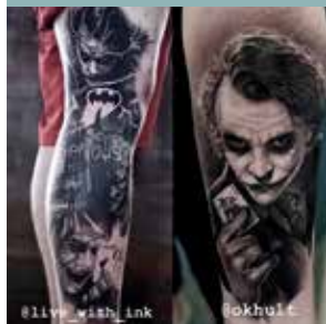
TATUERINGSSTUDIO KL. 14.00–22.00