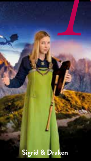
Sigrid & Draken