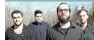
FINAL DAYS SOCIETY KL. 23.15