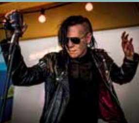
MASKINPOP KL. 22.45